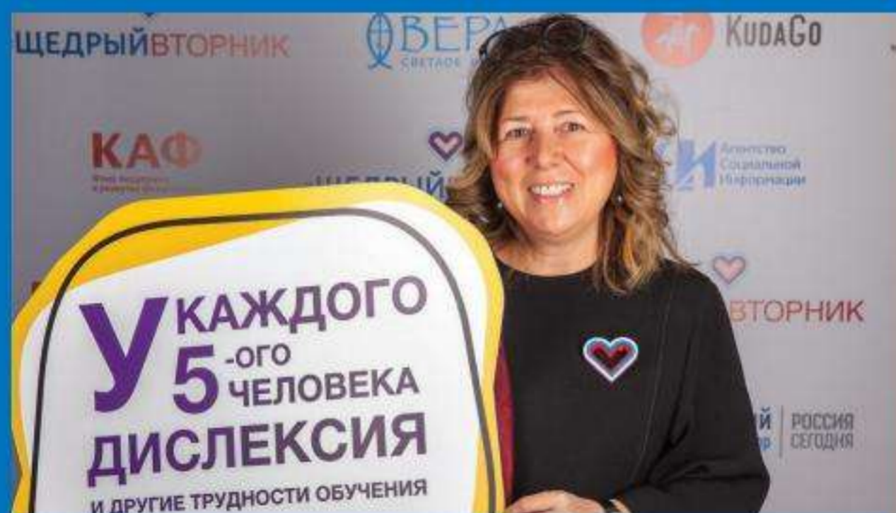
* Логотипы и шаблоны вы можете бесплатно скачать на сайте: щедрыйвторник.рф